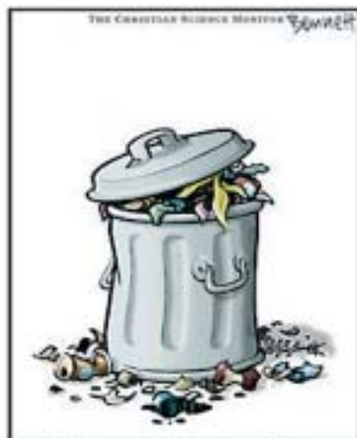
Televisão em Alta Definição

Fonte: http://www.claybennett.com/pages/ndtv.html